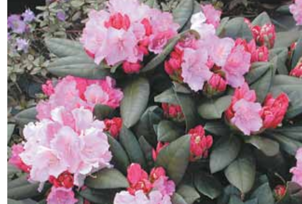
Rhododendron Yakushimanum hybrid

Vid torka vattna rejält en gång i veckan med ca 20-30 liter per planta. På hösten innan marken fryser ska rhododendron vattnas igenom rejält.