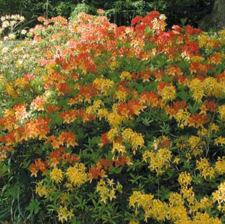
Azalea i sorter