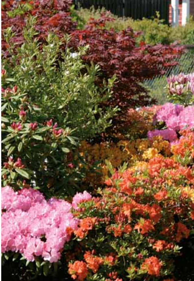
Plantering med "surjordsväxter"