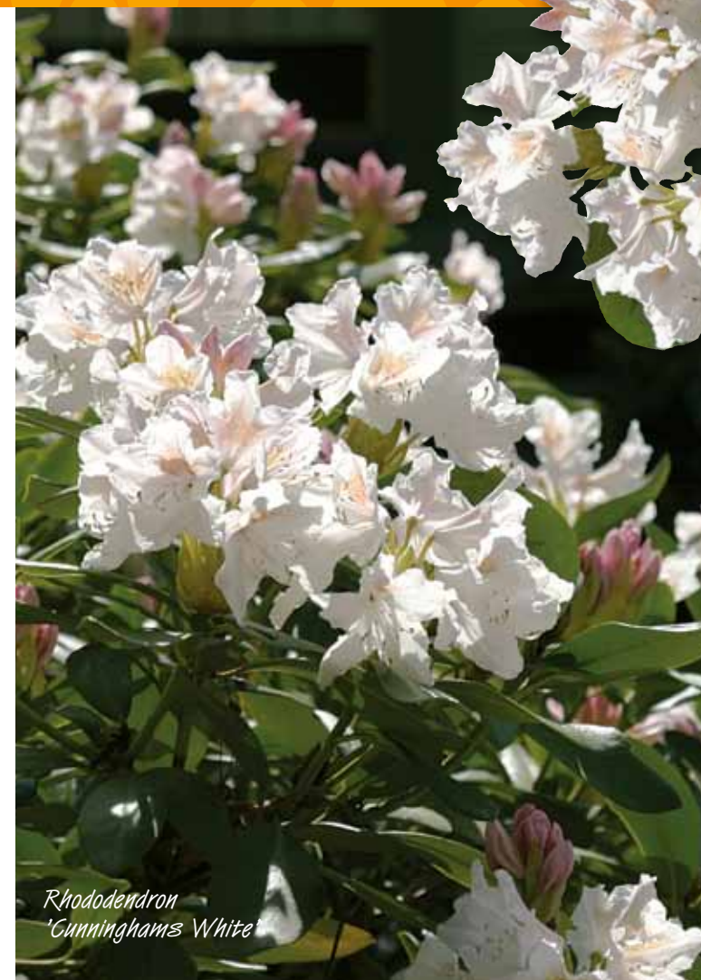
Rhododendron 'Cunninghams White'