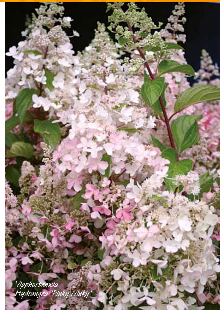
Vipphortensia Hydrangea 'Pinky Winky'