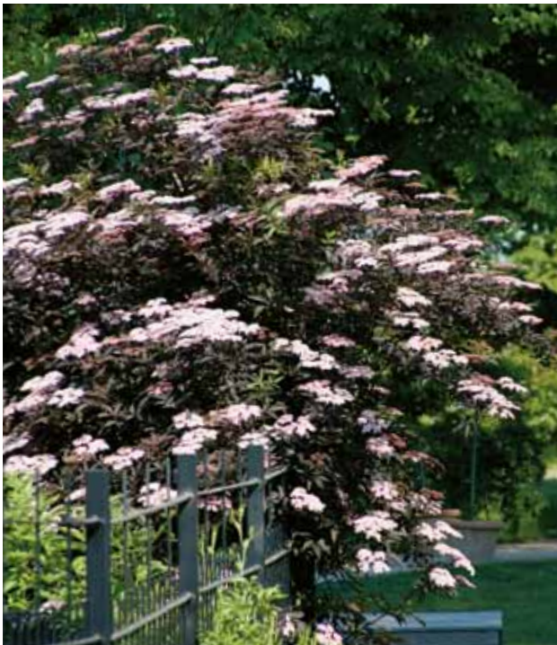
Blodfläder - Sambucus 'Black Beauty'

Ingen trädgård anläggs utan buskar. Det finns höga, snabbväxande och tätvuxna – idealiska som inramning, insynsskydd och avgränsningar. Medelhöga sorter med olika blomningstider från tidig vår till sen höst. Låga bredväxande sorter utmärkta som marktäckare både i full sol och skugga. Dvärgbuskar av olika slag som lämpar sig i stenpartier, i samplantering med rosor, perenner och barrväxter. Det finns sorter som trivs i allt från torra, soliga lägen till fuktiga och skuggiga.