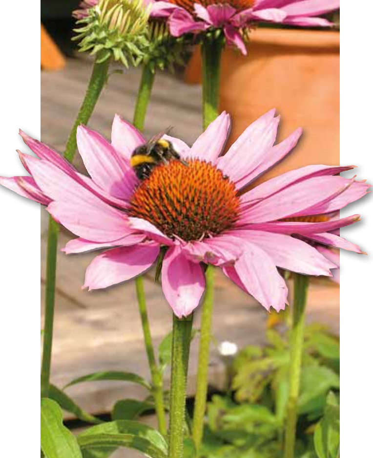
Solhatt - Echinacea purpurea