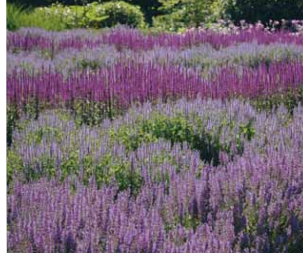
Stäppsalia - Salvia nemorosa i sorter

Vid torrt väder vattna rejält ca en gång i veckan så jorden kring rötterna blir genomfuktad. Håll jordytan lucker, det förhindrar uttorkning.