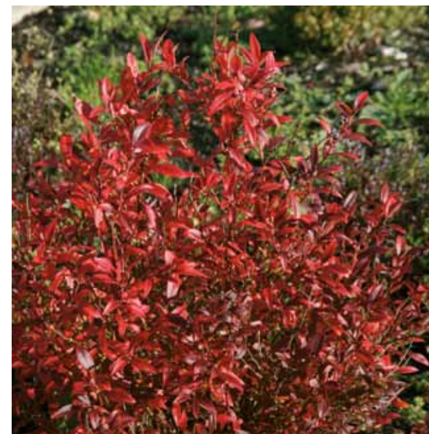
Blåbärsbusken får en härlig sprakande höstfärg.